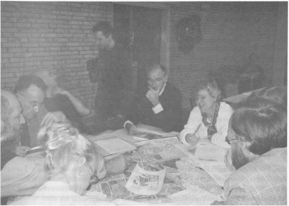
An Runden Tischen diskutierten die Bürger engagiert über die künftige Gestaltung ihrer Stadtteile.

Rahmenplangebiet Stellung zu nehmen. Dadurch wurde die Zeit für die Diskussion der Hauptthemen noch knapper, als sie ohnehin schon war. Kritische Stimmen wurden laut. Die vorgelegten rudimentären Pläne, Skizzen und Grundrisszeichnungen erregten den Unmut der Bürger.