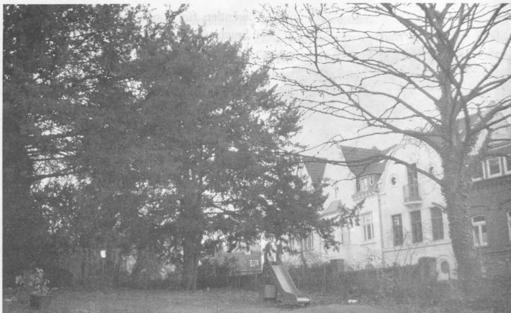
Links im Bild die ungewöhnlich großen und deshalb schützenswerten Eibengehölze am Eingang der KiTa Petershof

und Grünanlagen verwendet und stellt aufgrund der variablen Wuchsformen ein interessantes Gehölz dar.