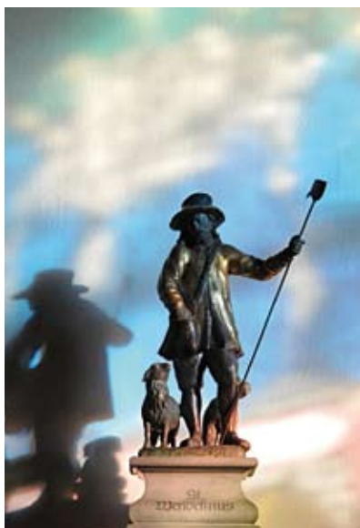
Heiliger Wendelinus (18. Jh.)