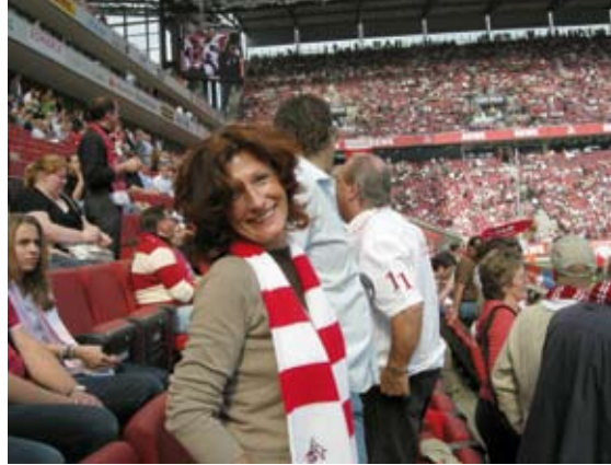
50.000 Zuschauer finden Platz im „Müngersdorfer Stadion“

1947 wurde die Sporthochschule der Universität zu Köln feierlich eröffnet, und zwar zunächst in der Trägerschaft der Stadt Köln. Sie nahm ihren Unterrichtsbetrieb unter der Leitung des Rektors Carl Diem in den vorhandenen Backsteinbauten des Stadions auf. In den Jahren 1960 bis 1963 wurde ein