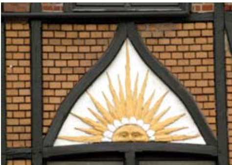
Detail Alter Militärring 11

Mit einem Blick auf die gegenüberliegende Straßenseite kann man eine Häuserfolge erfassen, die bis 1925 erbaut wurde und einen angenehm einheitlichen Eindruck vermittelt (Hausnummern 18 bis 26).