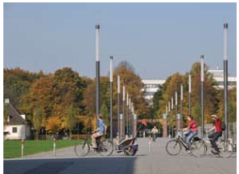
Hauptweg zum Stadion