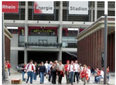
„Müngersdorfer Stadion“ (RheinEnergieStadion)