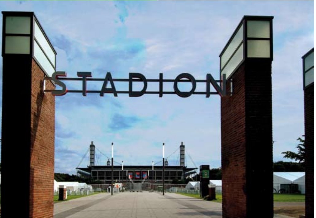
Eingang zum Stadion von der Aachener Straße