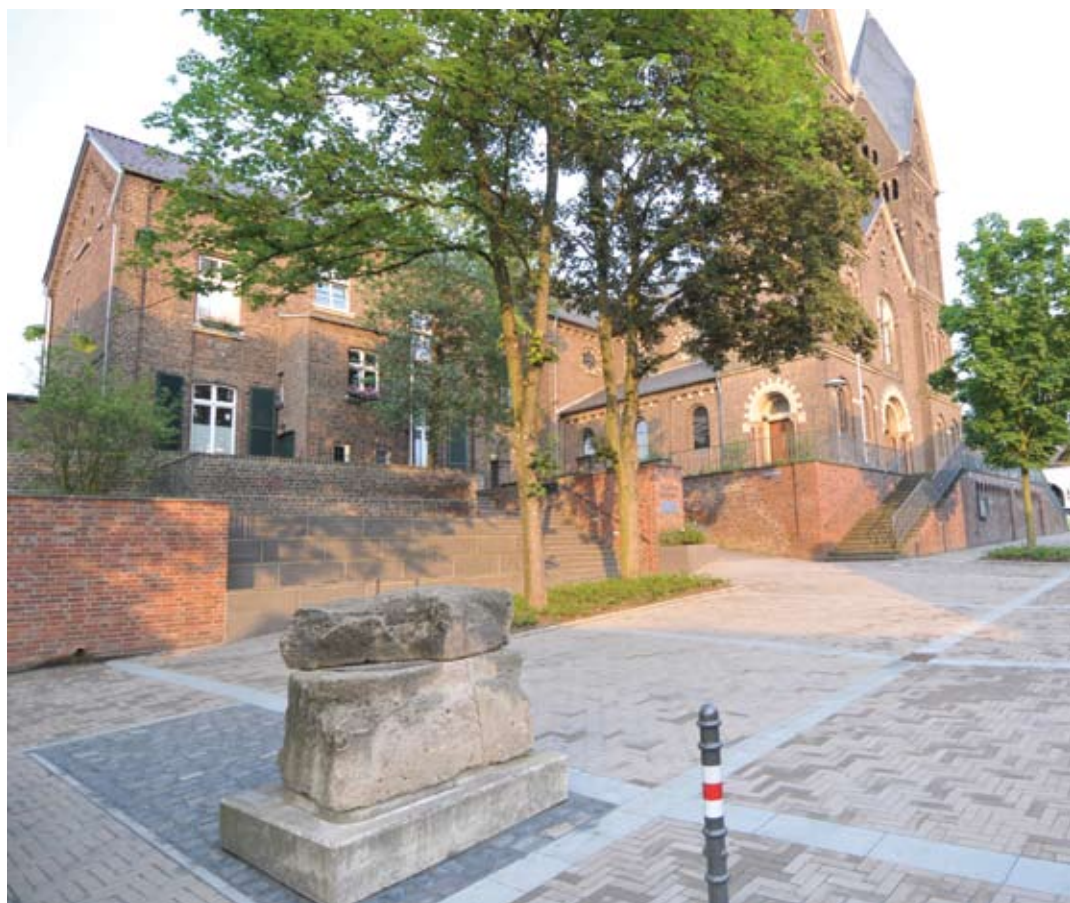
Katholische Kirche St. Vitalis und Pfarrhaus, im Vordergrund das römische Brandgrab

Wir starten unseren Rundgang auf dem Dorfplatz und entdecken den ursprünglichen Dorfkern mit seiner Pfarrkirche St. Vitalis, den Höfen und Fachwerkhäusern, den Stadtvillen und den über Köln hinaus bekannten „Künstlerhäusern“.