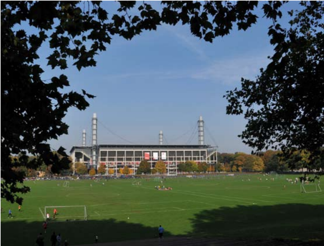
Das Stadion und die Jahnwiese

Jetzt wird es sportlich. Und modern. Zwischen ausgedehnten Grünanlagen erkunden wir das „Müngersdorfer Stadion“ mit seinen verschiedenen Sportstätten und entdecken nördlich der Aachener Straße in den Wohngebieten „Malerviertel“ und „Egelspfad“ diverse architektonische Highlights der jüngeren Geschichte.