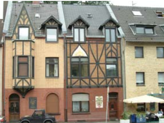
Alter Militärring 9-13

Das Haus Nummer 13 mit der Gaststätte „Em Ringströbje“ war noch im Jahr 1900 eines von nur drei Häusern der früheren „Ringstraße“ und damals von Feldern umgeben. In seiner Nachbarschaft im oberen Teil des Alten Militärrings entstanden seit der Jahrhundertwende einige noch heute gut erhaltene Wohngebäude mit teilweise aufwändig gestalteten Fassaden.