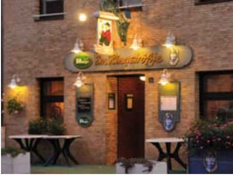
Alter Militärring 13

Wir starten an der Ecke Aachener Straße/Alter Militärring, wo es schon von jeher Gaststätten gegeben hat, die an dieser großen Kölner Ausfallstraße Reisende und Einheimische bewirteten. Wir gehen in nördliche Richtung auf dem „Alten Militärring“, der seit 1986 durch die Inbetriebnahme der Ortsumgehung, den so genannten neuen Militärring, weniger Verkehrsbelastungen ausgesetzt ist.