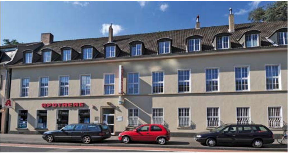
Alter Militärring 19

Jahr 1905 erfolgte mit 243 Kindern der Umzug in die neue Schule in der Wendelinstraße 64 (S. 50).