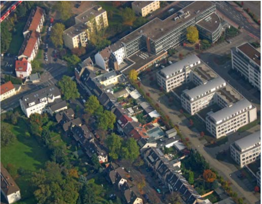
Luftbild Vitalisstraße und TechnologiePark Köln

Villenarchitektur, Mehrfamilienhäuser, gewerbliche Anlagen, Bürobauten, vornehme Wohnstraßen: Dieser Spazierweg zeigt die vielfältigen Gesichter Müngersdorfs auf eindrucksvolle Weise.