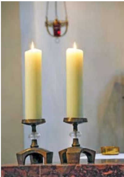
Altarleuchter von Hildegard Domizlaff