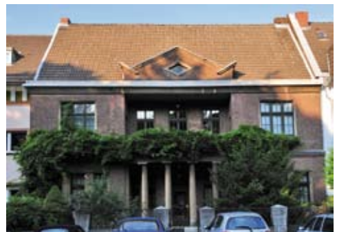
Alter Militärring 42

Die exklusive Villa wurde im englisch-klassizistischen Stil errichtet. Durch Stilelemente wie den Portikus, getragen von Säulen aus Werkstein, hob es sich schon zum Erbauungszeitpunkt von der Nachbarbebauung ab.