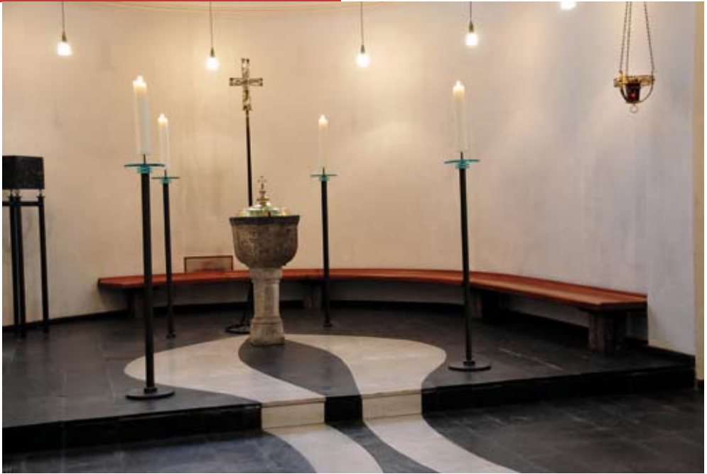
Apsis von St. Vitalis mit Taufbecken