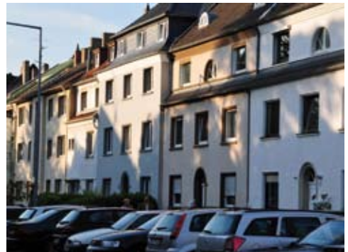
Alter Militärring 22-28

Das alte Schulgebäude wurde im Zweiten Weltkrieg zerstört. Der 1955 errichtete Neubau wurde von der katholischen Pfarrgemeinde St. Vitalis als Pfarrheim genutzt, bis 1986 das neue Pfarrheim am Alten Militärring 41 eingeweiht wurde.